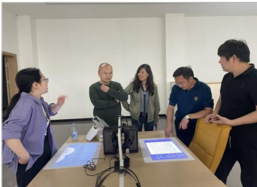
东湖学院南校区图书馆智慧空间