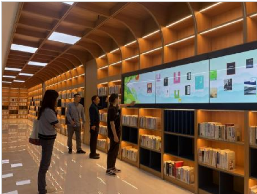
首义学院嘉鱼校区图书馆文化长廊