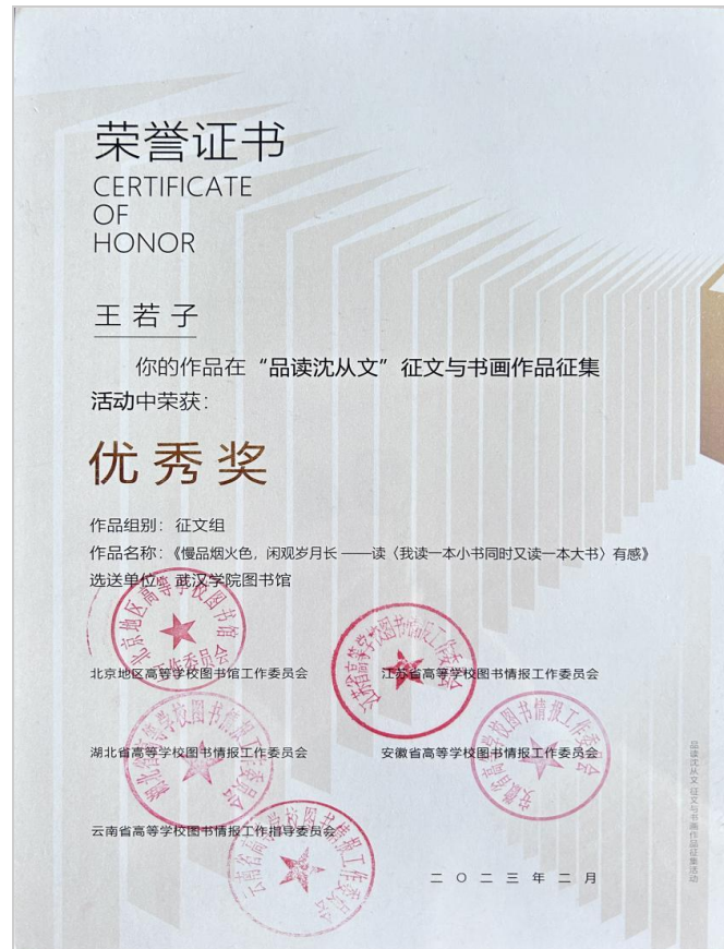
新闻学 2001 班王若子

该项活动于 2022 年 4 月 23 日正式启动，通过“设计师之家数字图书馆”平台在线报名与投稿，全国各地高校积极参与。至 2022 年 9 月 23 日征集截止，共收到作品 1422 件，其中征文作品 854 件，书画作品 568 件。我校学子从众多征集作品中脱颖而出，实属不易。