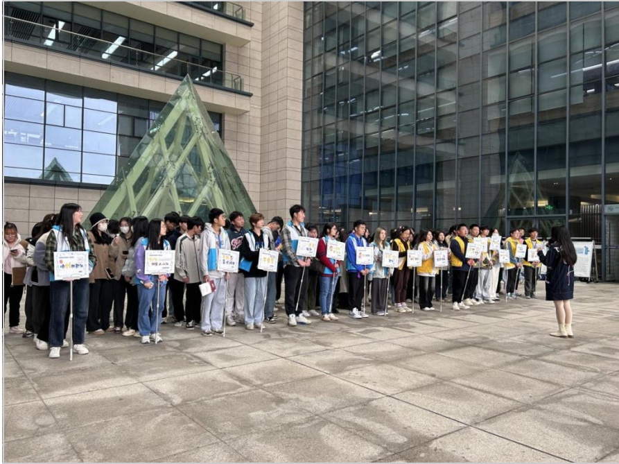
主持人宣读比赛规则