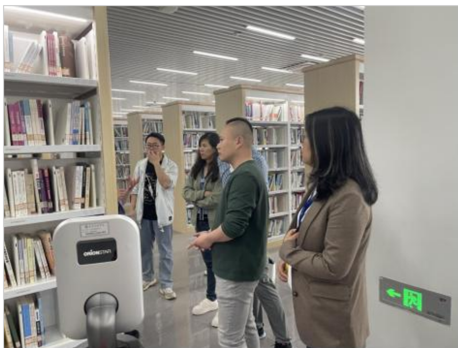
东湖学院南校区智能书架现场

此次外出考察调研，不仅加强了兄弟院校之间的沟通交流，深入了解了不同图书馆的管理模式和智慧服务理念，对我校图书馆六楼空间功能布局和建设思路有启发和借鉴。