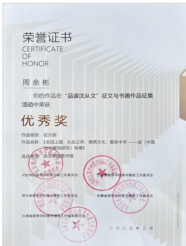
金融学 2102 班周余彬获奖证书

由北京地区高等学校图书馆工作委员会、江苏省高等学校图书情报工作委员会、湖北省高等学校图书情报工作委员会、安徽省高等学校图书情报工作委员会、云南省高等学校图书情报工作指导委员会共同主办的“品读沈从文”征文与书画作品征集活动，于日前公布获奖信息，我校金融学 2102 班周余彬同学、新闻学 2001 班王若子同学喜获优秀奖。