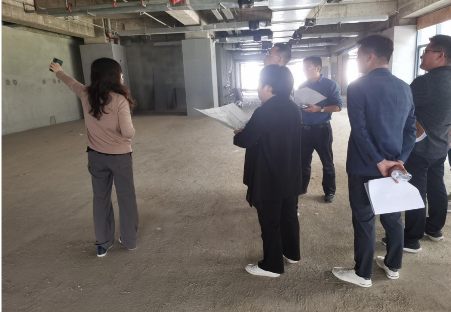
图书馆六楼实地查看

的定点定位、光源照明及降噪等问题进行了探讨。会后，大家一起到六楼进行了实地查看。