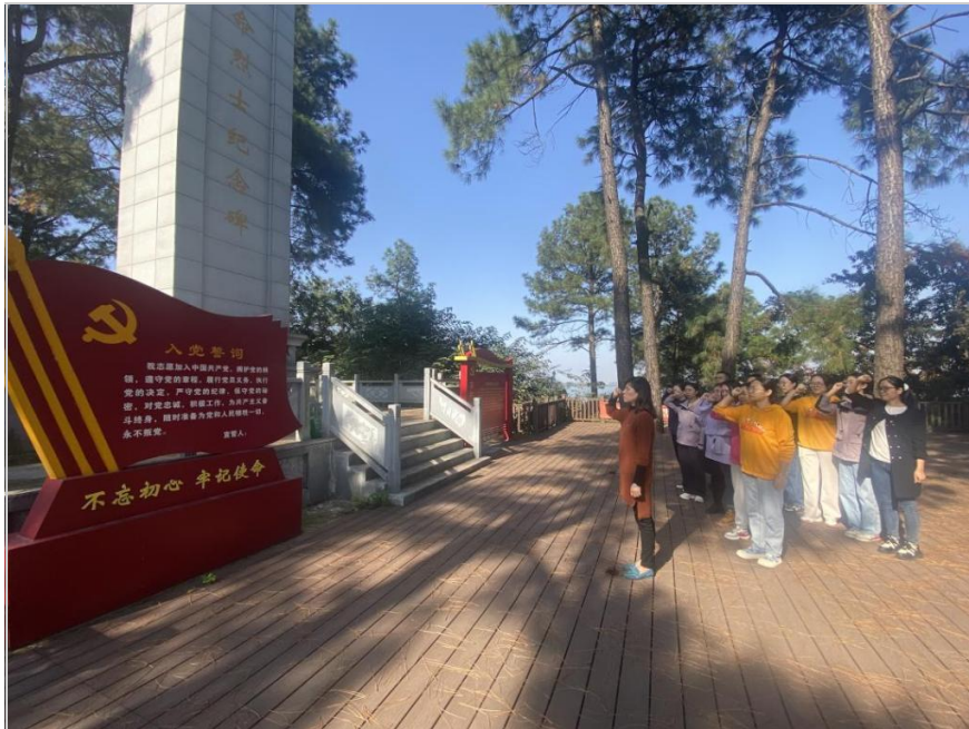
全体党员重温入党誓词