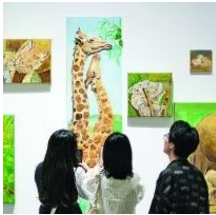
学生在 2023 南通大学艺术学院毕业展上参观。