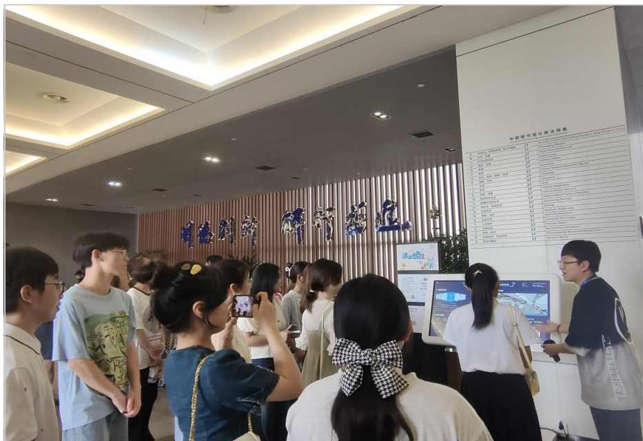
“图管会”成员进行参观讲解