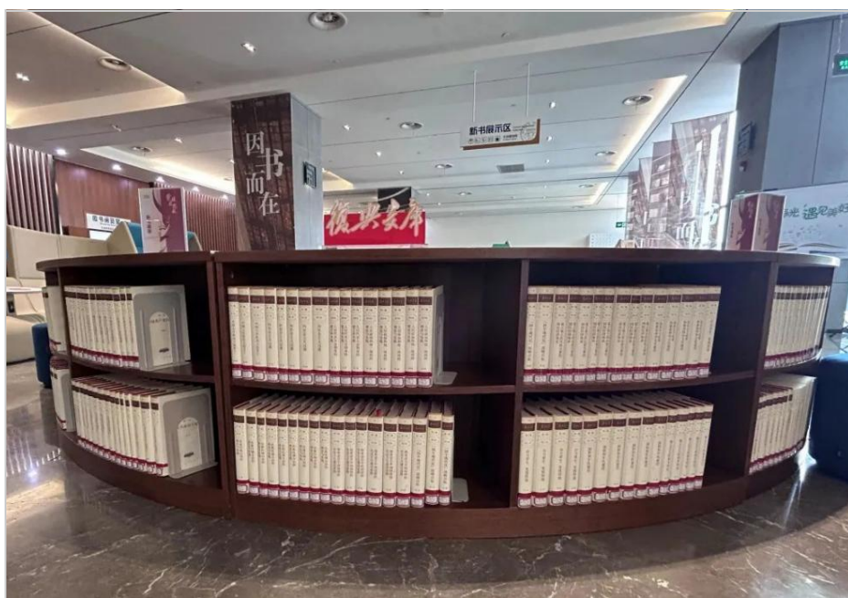
《复兴文库》专题展柜

近日，大型历史文献丛书《复兴文库》入藏武汉学院图书馆。为了进一步发挥优秀典籍对发展社会主义先进文化、弘扬革命文化、传承中华优秀传统文化的重要作用，让这一重大出版成果能够更好地发挥教育功能、彰显时代价值，修史立典，存史启智，以文化人。图书馆在二楼新书展示区设立复兴文库专架，供全校师生借阅。