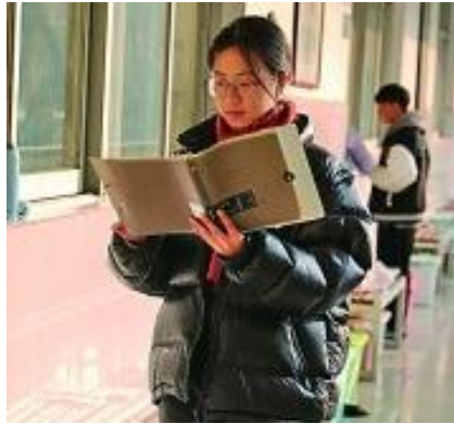
湖南省衡阳市南华大学的学生在图书馆阅读。